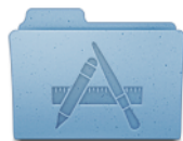
アプリケーション

スタックの内容は、その項目数に基づいて、自動的にファンまたはグリッド状に表示されます。スタックをリストで表示することもできます。どちらかのスタイルを優先したい場合は、常にそのスタイルで開くようにスタックを設定できます。